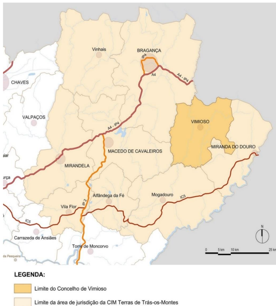
Figura 2. Enquadramento sub-regional do Município de Vimioso

Situado no Nordeste Transmontano, no distrito de Bragança, o concelho de Vimioso (Figura 2) apresenta uma superfície territorial aproximada de 481,47 km 2 , dividida em 10 freguesias, onde em 2021 residiam 4 149 pessoas. O concelho é limitado, a este por Miranda do Douro, a sul por Mogadouro, a sudoeste por Macedo de Cavaleiros e a oeste e noroeste por Bragança, fazendo ainda fronteira, a norte, com Espanha (Alcañices).