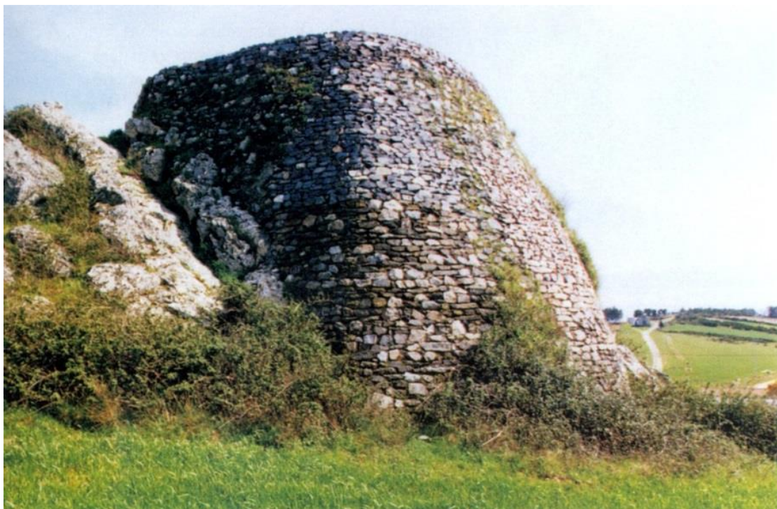
Figura 5. Torre da Atalaia, Vimioso

Relativamente à dinamização da vila, atualmente, um dos eventos mais importantes do concelho é a Feira de Artes, Ofícios e Sabores de Vimioso, que acontece anualmente em dezembro. As atividades promovidas na feira são compostas por diversas vertentes, como artesanato, produtos regionais, concurso de doçaria da castanha, atuações musicais, montaria ao javali, raid TT e muitas outras. Também na feira de S. Lourenço, a 10 de agosto, realiza-se um concurso de gado bovino de raça mirandesa e lutas de touros, eventos que dinamizam a vila, recebendo pessoas vindas das aldeias do concelho e residentes nos concelhos vizinhos.