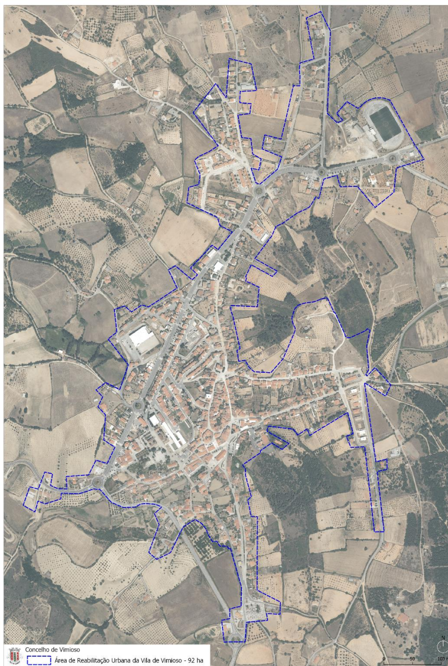
Figura 6. Delimitação da ARU da Vila de Vimioso sobre ortofotomapa

A proposta de alteração da delimitação da ARU de Vila de Vimioso considera 92 hectares do território. A sua delimitação contempla todo o perímetro urbano da Vila de Vimioso e compreende não apenas áreas com problemas de degradação ou obsolescência dos edifícios, mas também os principais equipamentos de uso coletivo e elementos patrimoniais relevantes, bem como espaços públicos com necessidades de qualificação e valorização. Apresentam-se em anexo a planta da ARU sobre a cartografia de base topográfica e a planta da ARU sobre o ortofotomapa de 2021.