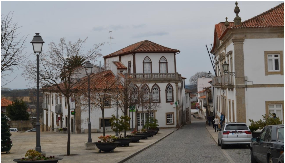
Figura 1. Núcleo urbano da Vila de Vimioso

A delimitação de uma ARU obriga o Município a definir os apoios e benefícios fiscais, associados aos impostos municipais sobre o património, a conceder aos proprietários e detentores de direitos sobre o património edificado, objeto das ações de reabilitação urbana.