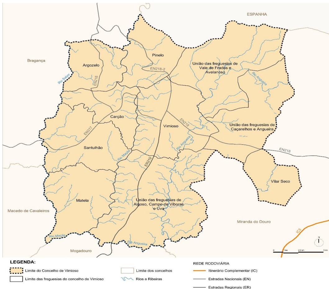
Figura 3. Enquadramento geográfico do Município de Vimioso

O concelho de Vimioso subdivide-se em 10 freguesias: Argozelo, Carção, Matela, Pinelo, Santulhão, União de Freguesias (UF) de Algosos, Campo de Víboras e Uva, UF de Caçarelhos e Angueira; UF de Vale de Frades e Avelanoso, Vilar Seco e Vimioso (Figura 3).