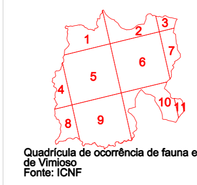
Quadrículas de ocorrência de fauna e flora da Diretiva Habitats no concelho de Vimioso.

CARTOGRAFIA DE BASE Entidade Proprietária: Município de Vimioso Entidade Proponente: Sigegeo Geomatic Solutions, Lda Sistema cartográfico: UTM Data de edição: 2017 Data de homologação: 21-07-2009 Nº de homologação: 87 Entidade Responsável pela homologação: Instituto Geográfico Português Sistema de Referência: Datum 73 (Meridiano) Sistema de projeção: Gauss - Kruger Escala gráfica: 1:5000 Exatidão planimétrica: 80% Precisão Posicional Nominal: desvio inferior a 3m