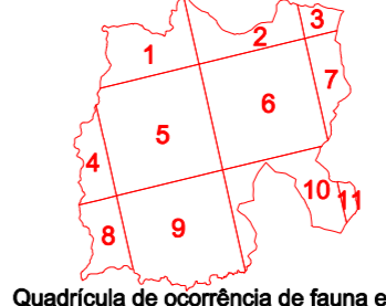
Quadrículas de ocorrência de fauna e flora da Diretiva Habitats no concelho de Vimioso.

CARTOGRAFIA DE BASE Entidade Proprietária: Município de Vimioso Entidade Proponente: Sigegeo Geomatic Solutions, Lda Sistema cartográfico: UTM Data de edição: 2007 Data de homologação: 21-07-2009 Nº de homologação: 87 Entidade Responsável pela homologação: Instituto Geográfico Português Sistema de Referência: Datum 73 Sistema de projeção: Gauss - Kruger Escala: 1:50000 Exatidão temática: 80% Precisão Posicional Nominal: desvio inferior a 3m